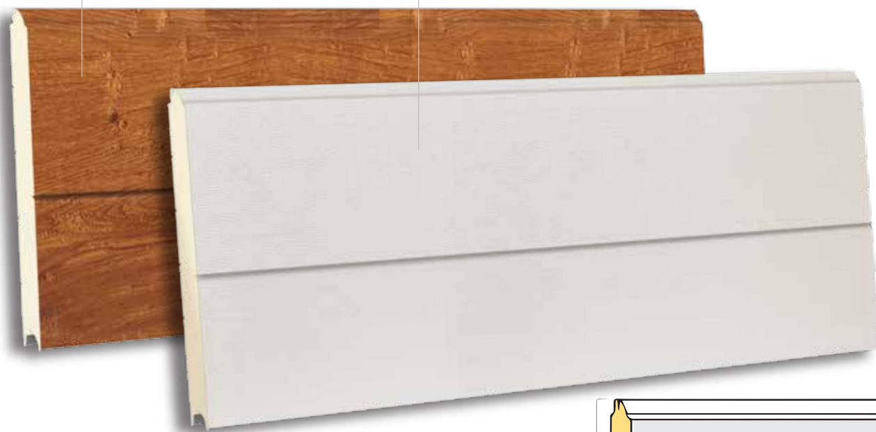
TSV 610 RAL 9010 - WOODGRAIN