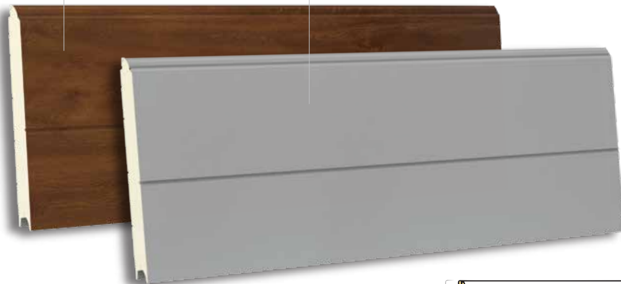
TSV 500 RAL 9006- WOODGRAIN