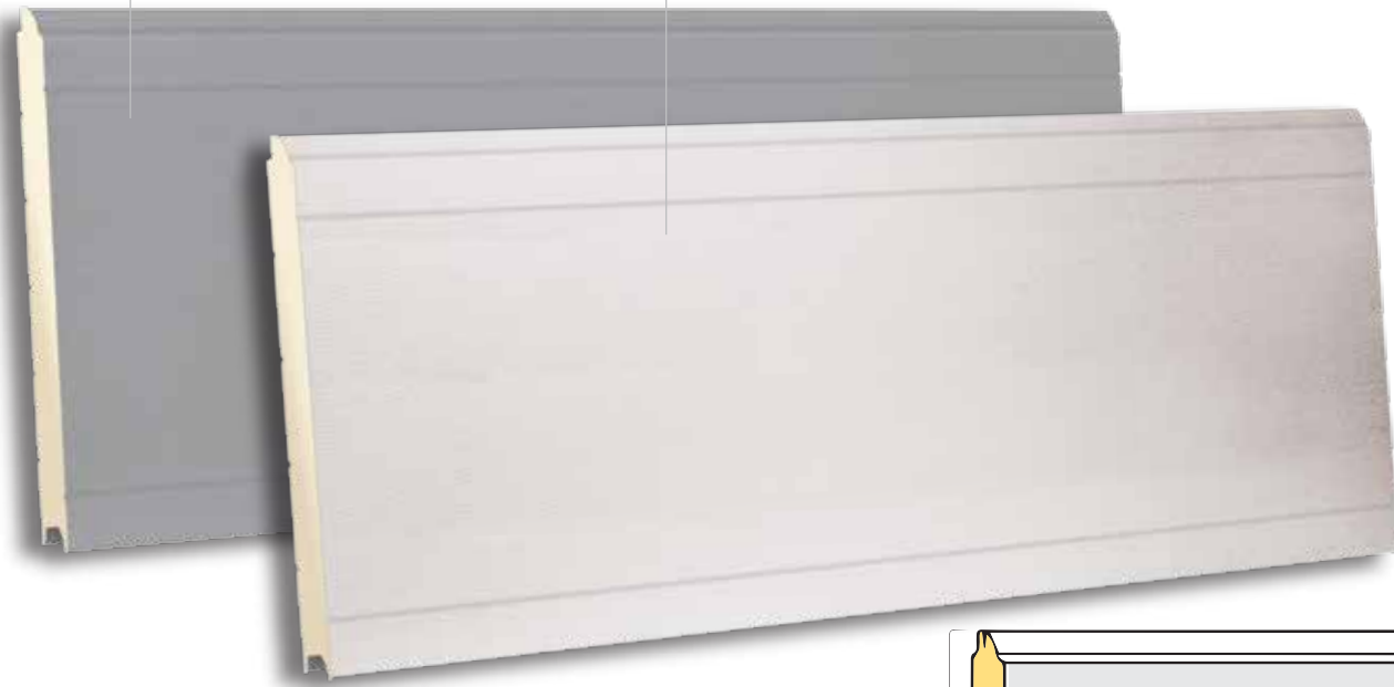
TST 610 RAL 9010 - WOODGRAIN