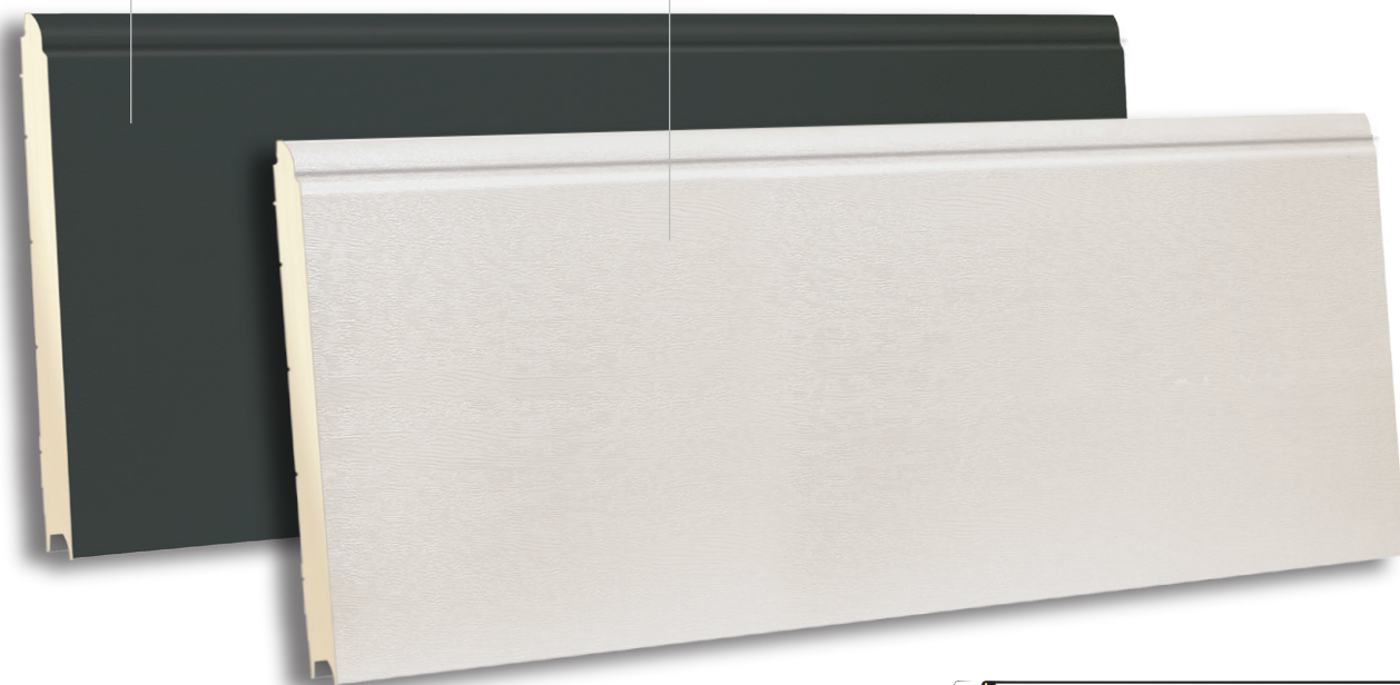
TSS 610 RAL 9002- WOODGRAIN