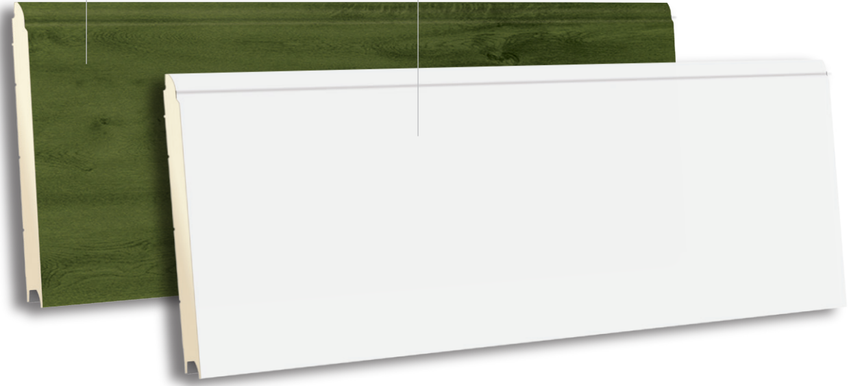
TSS 500 RAL 9016 - POLYGRAIN