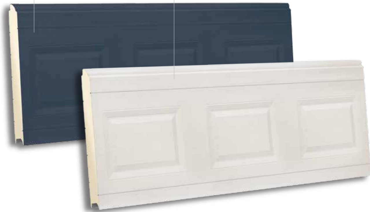
TSQ 610 RAL 9002 - WOODGRAIN