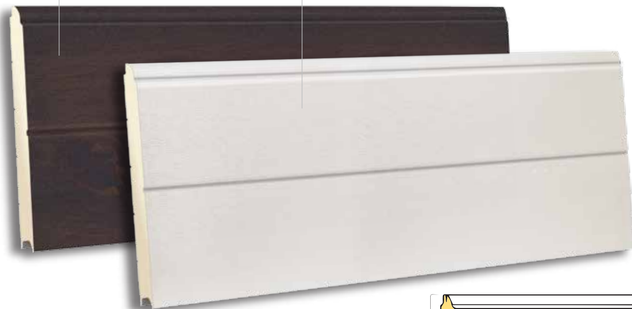
TSL 610 RAL 9010- WOODGRAIN