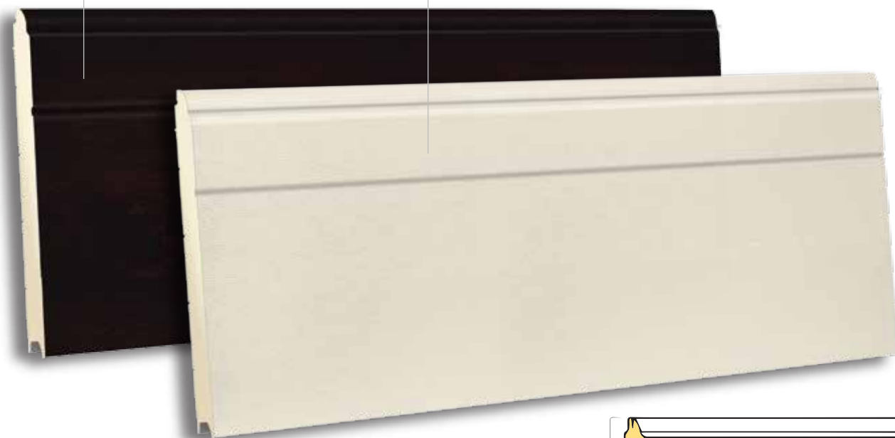
TSD 610 RAL 9002- WOODGRAIN