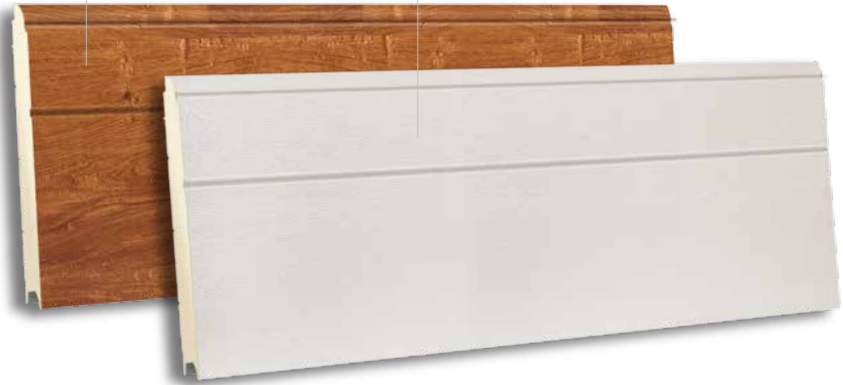
TSD 500 RAL 9010 - WOODGRAIN