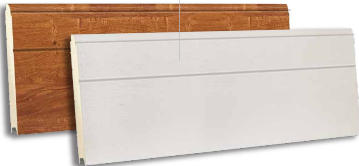
TSD 500 RAL 9010 - WOODGRAIN