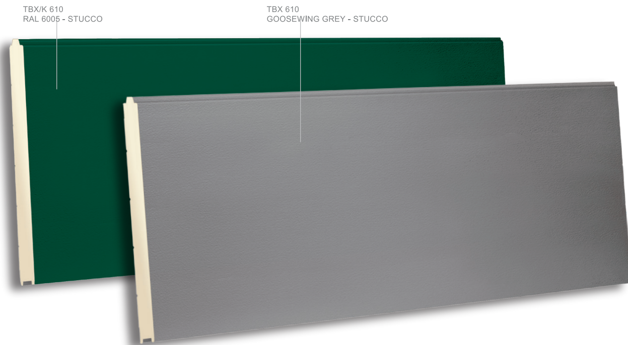
TBX/K 610 RAL 6005 - STUCCO