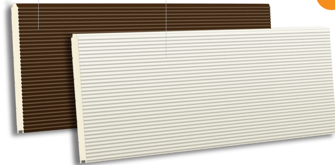
TBR/K V16 610 RAL 9010 - LISSE