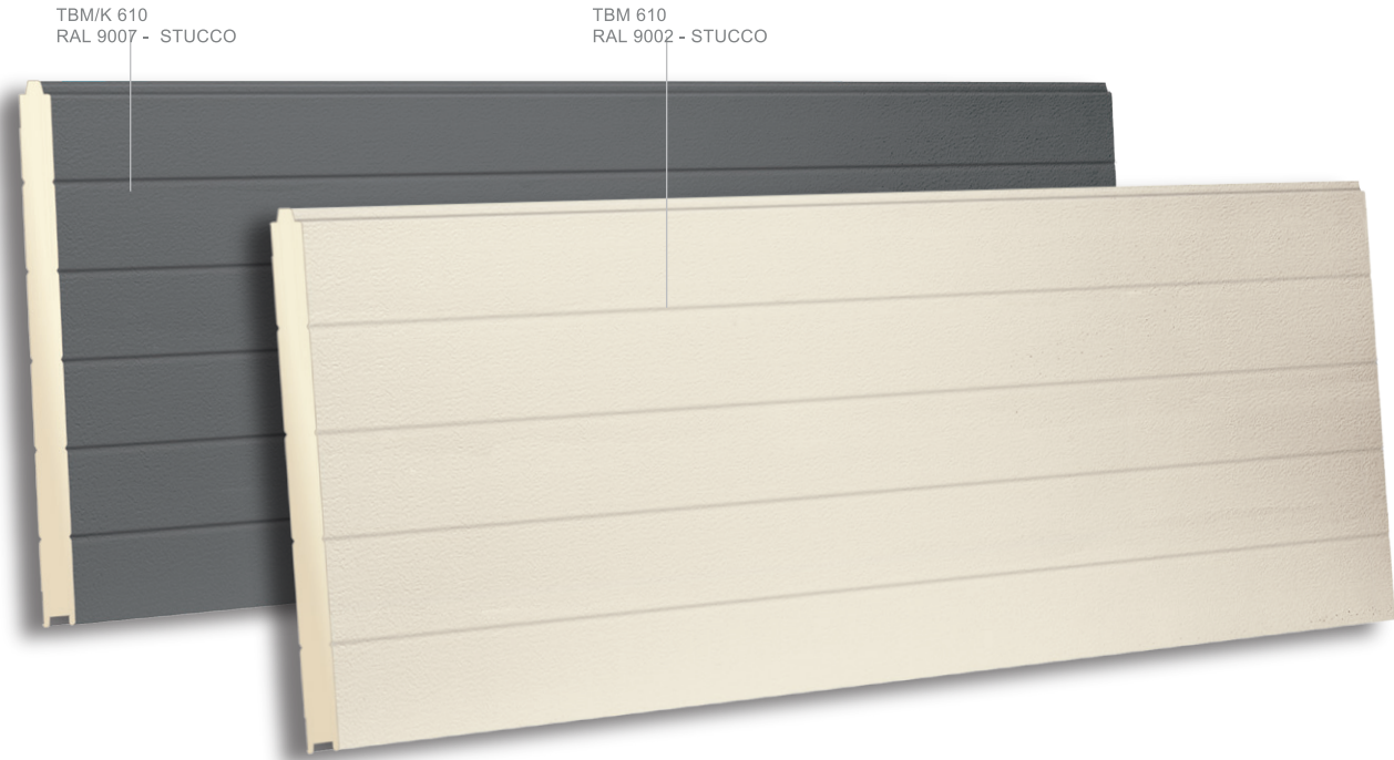
TBM/K 610 RAL 9007 - STUCCO