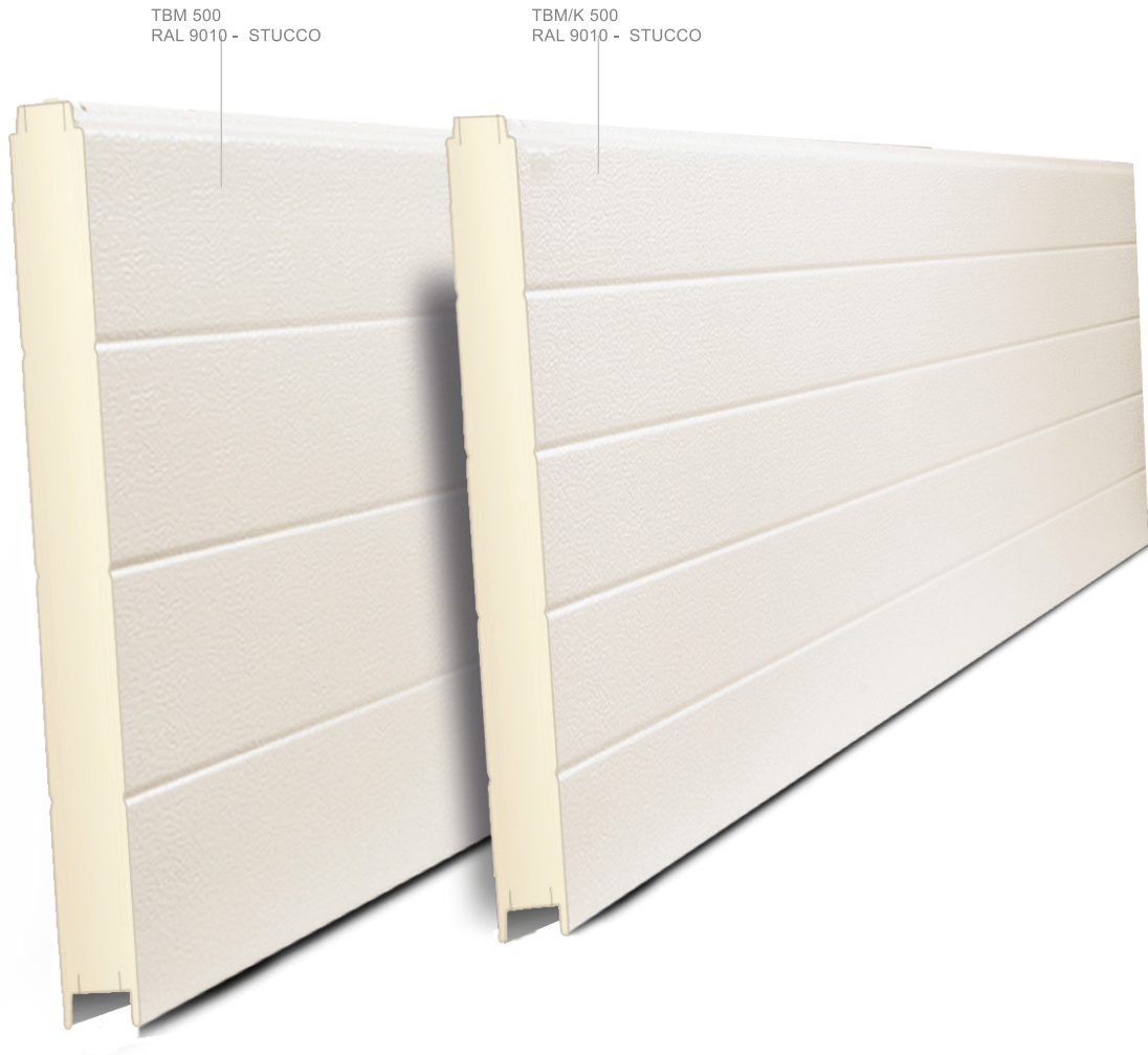
TBM 500 RAL 9010 - STUCCO