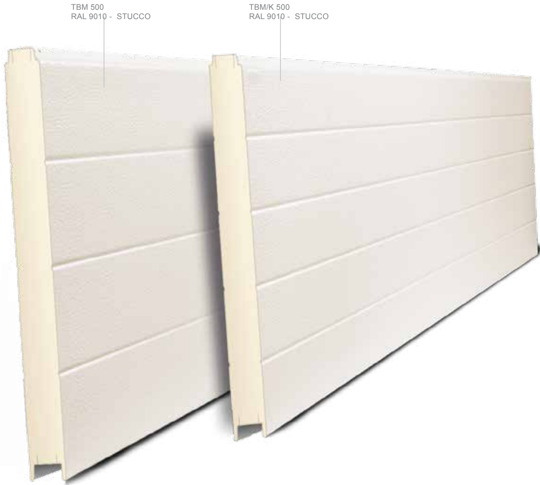
TBM 500 RAL 9010 - STUCCO