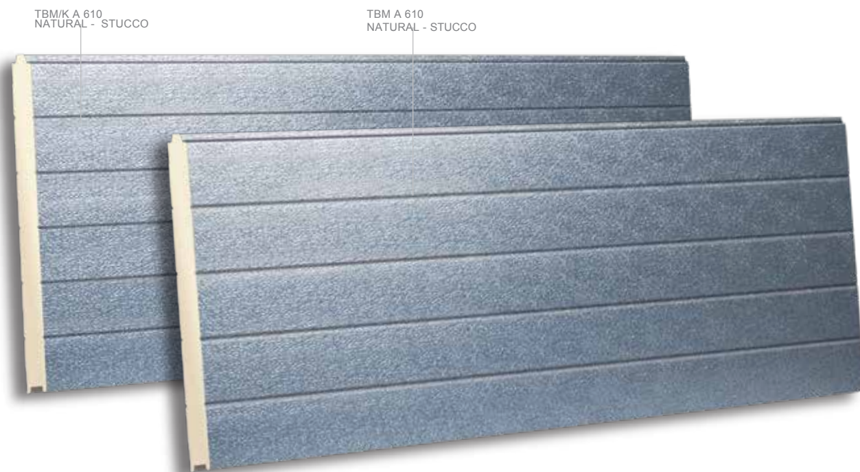
TBM/K A 610 NATURAL - STUCCO