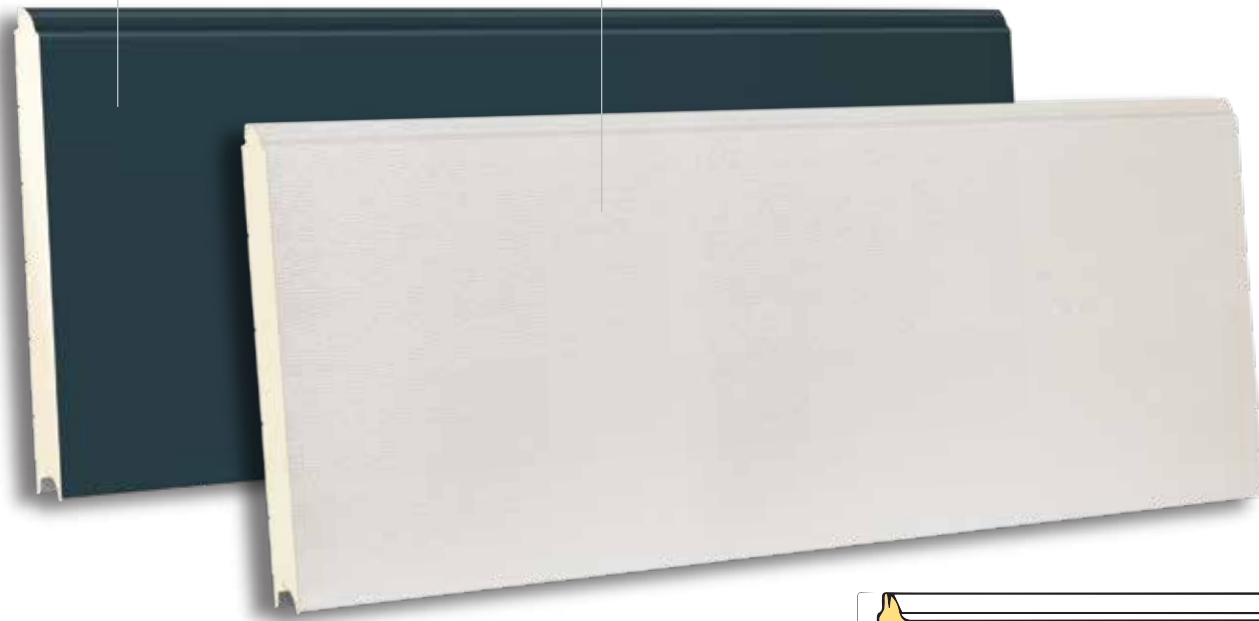
TSX 610 RAL 9002- WOODGRAIN