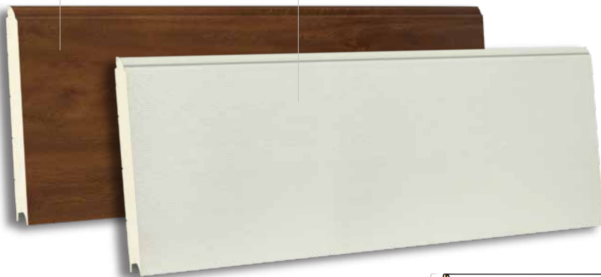
TSX 500 RAL 9010- WOODGRAIN