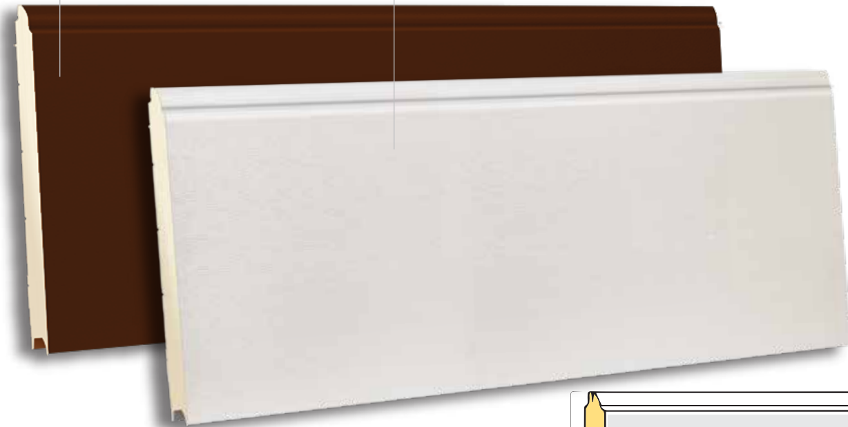
TSS 610 RAL 9002- WOODGRAIN