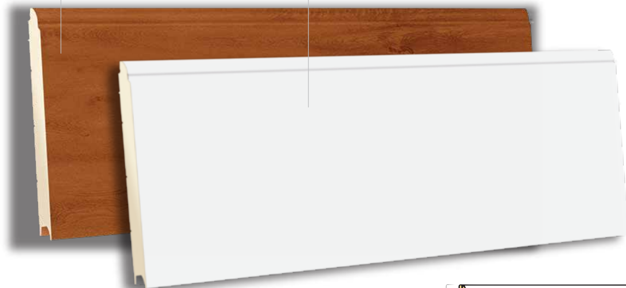
TSS 500 RAL 9016 - POLYGRAIN