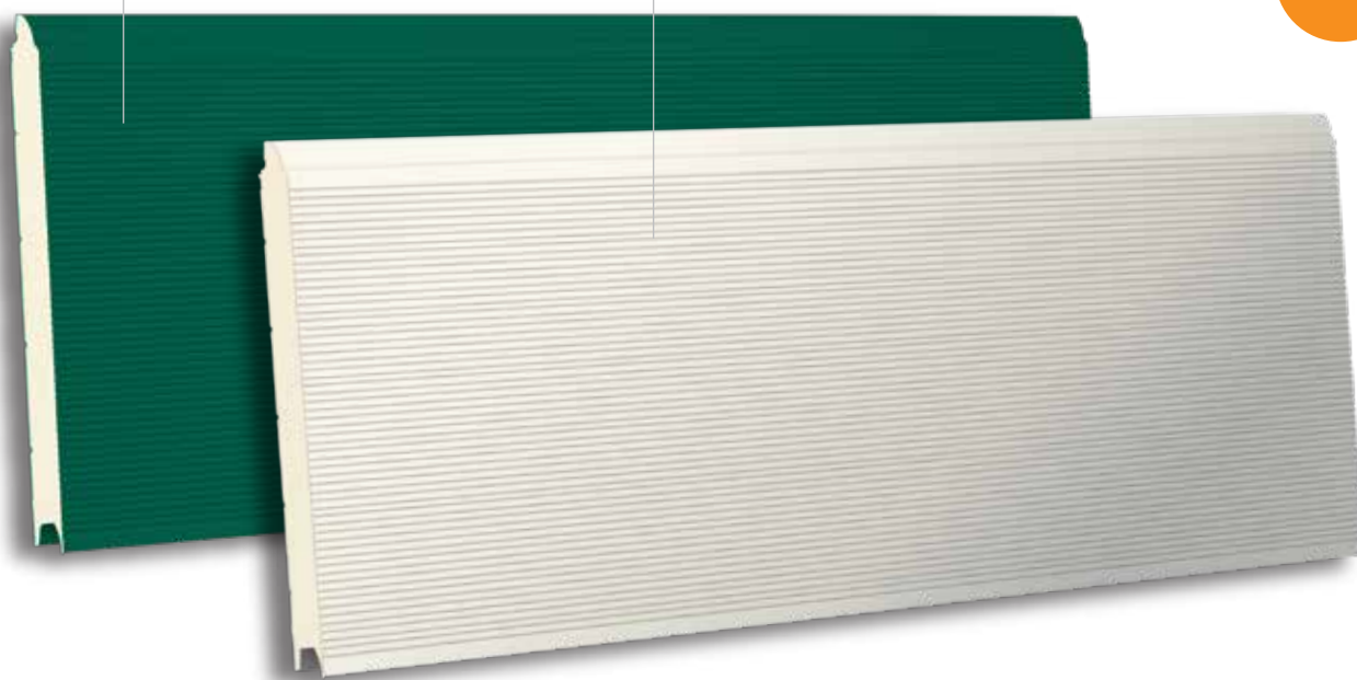
TSR V8 610 RAL 9010 - LISSE