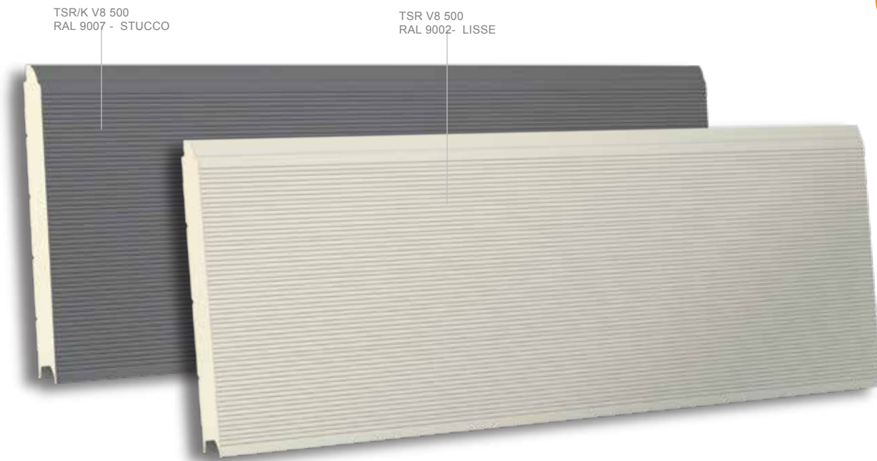
TSR/K V8 500 RAL 9007 - STUCCO