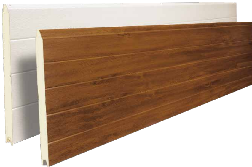
TSM/K 500 V-GOLDEN - WOODGRAIN