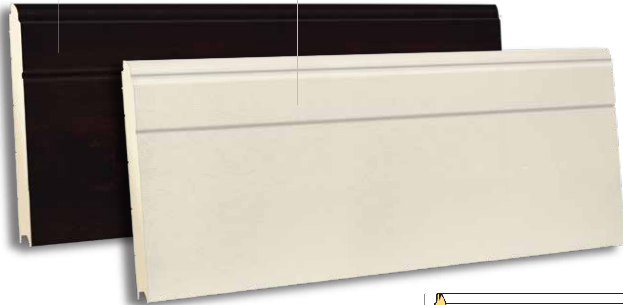
TSD 610 RAL 9002- WOODGRAIN