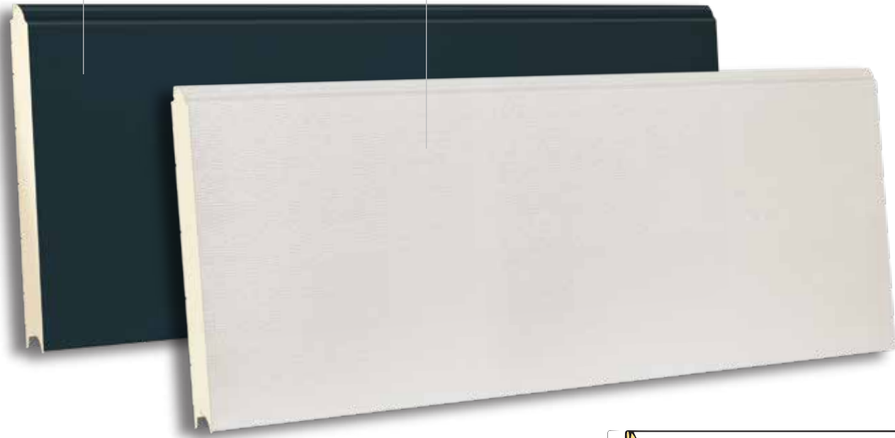
TSX 610 RAL 9002- WOODGRAIN