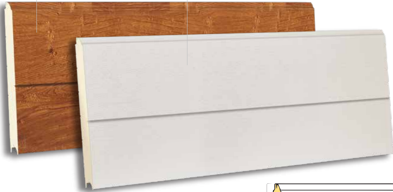
TSV 610 RAL 9010 - WOODGRAIN