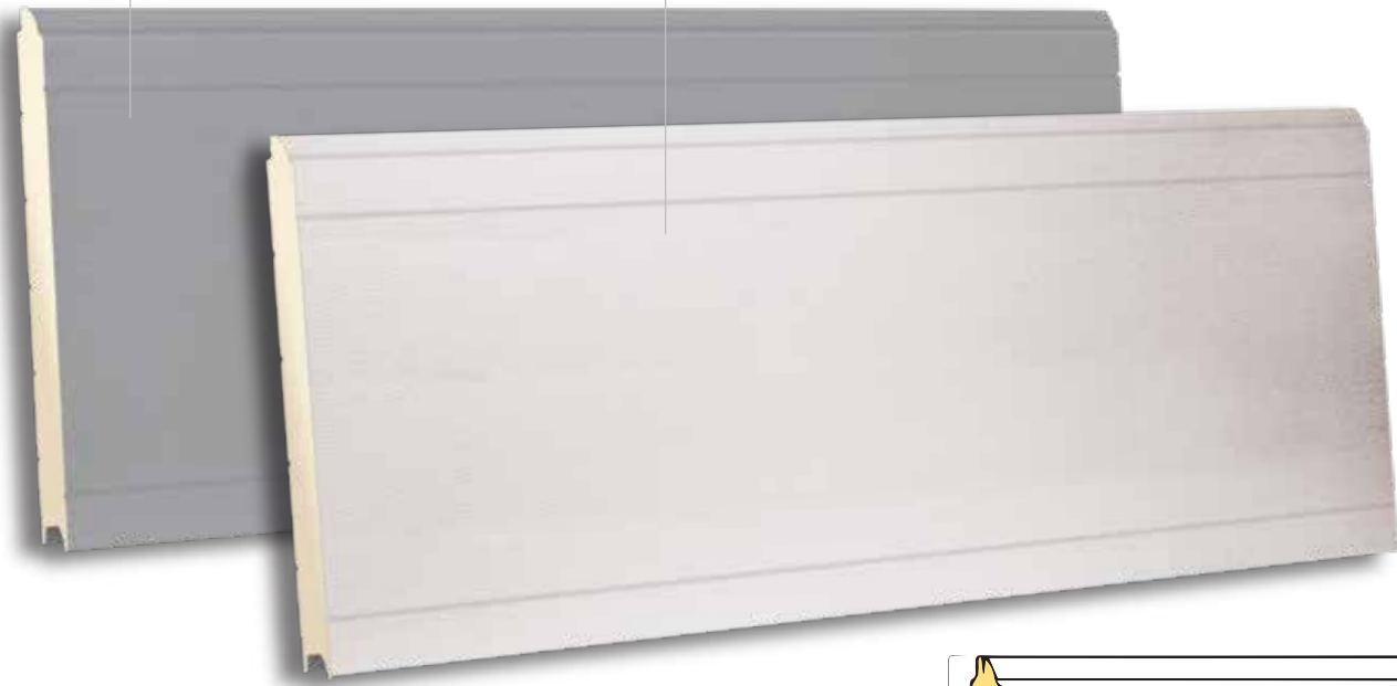
TST 610 RAL 9010 - WOODGRAIN