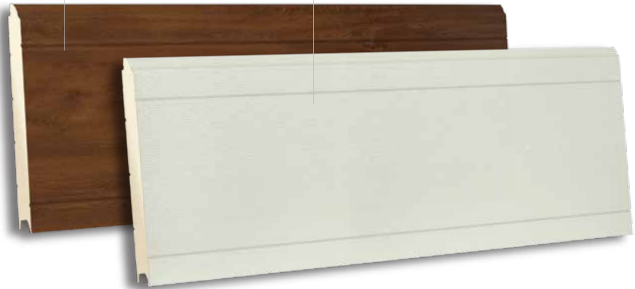
TST 500 9002 - WOODGRAIN