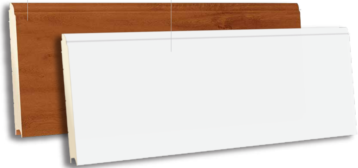
TSS 500 RAL 9016 - POLYGRAIN