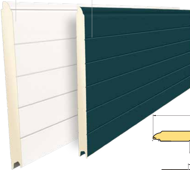
TSM/K 610 RAL 7016 - SANDGRAIN