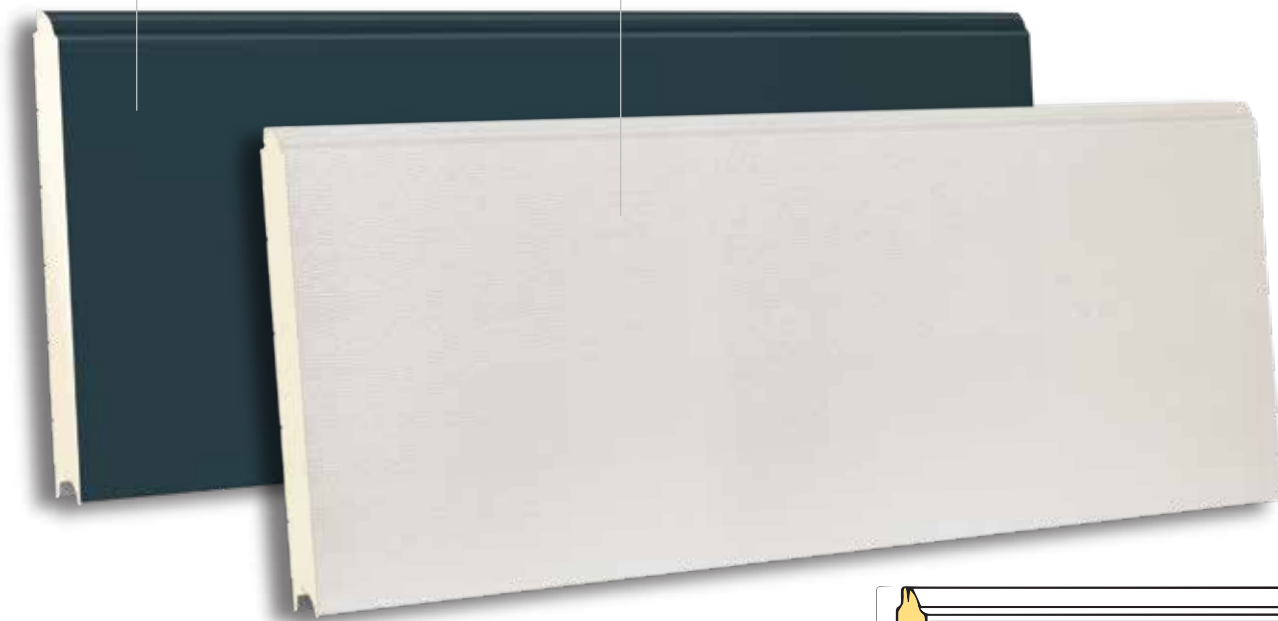
TSX 610 RAL 9002- WOODGRAIN