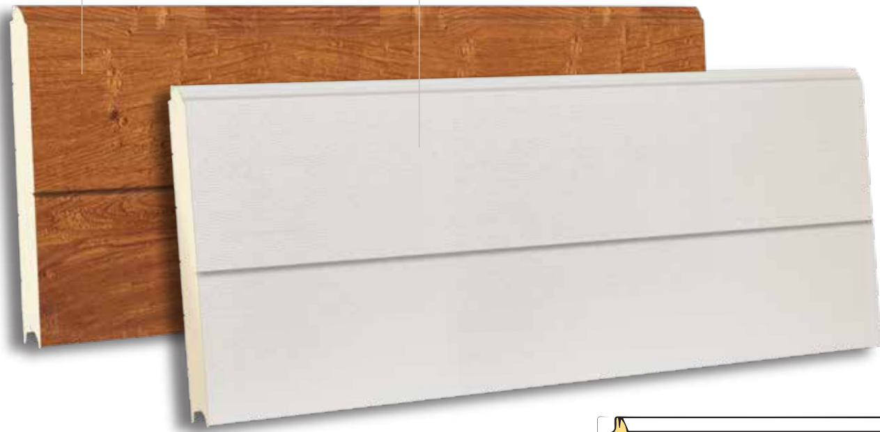
TSV 610 RAL 9010 - WOODGRAIN