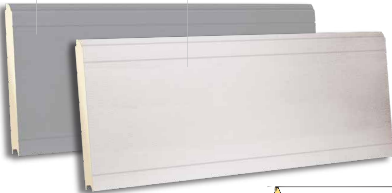
TST 610 RAL 9010 - WOODGRAIN