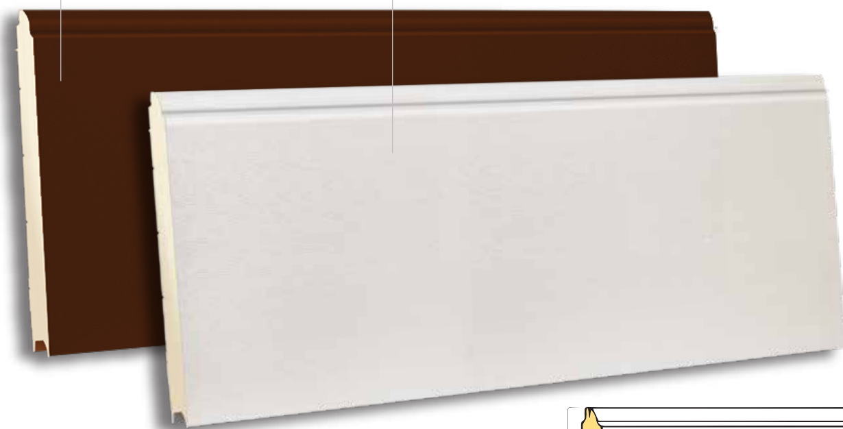
TSS 610 RAL 9002- WOODGRAIN