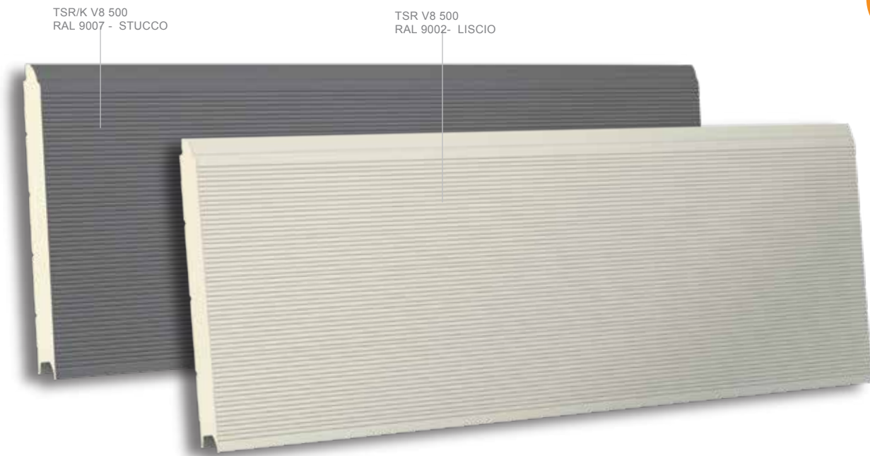
TSR/K V8 500 RAL 9007 - STUCCO