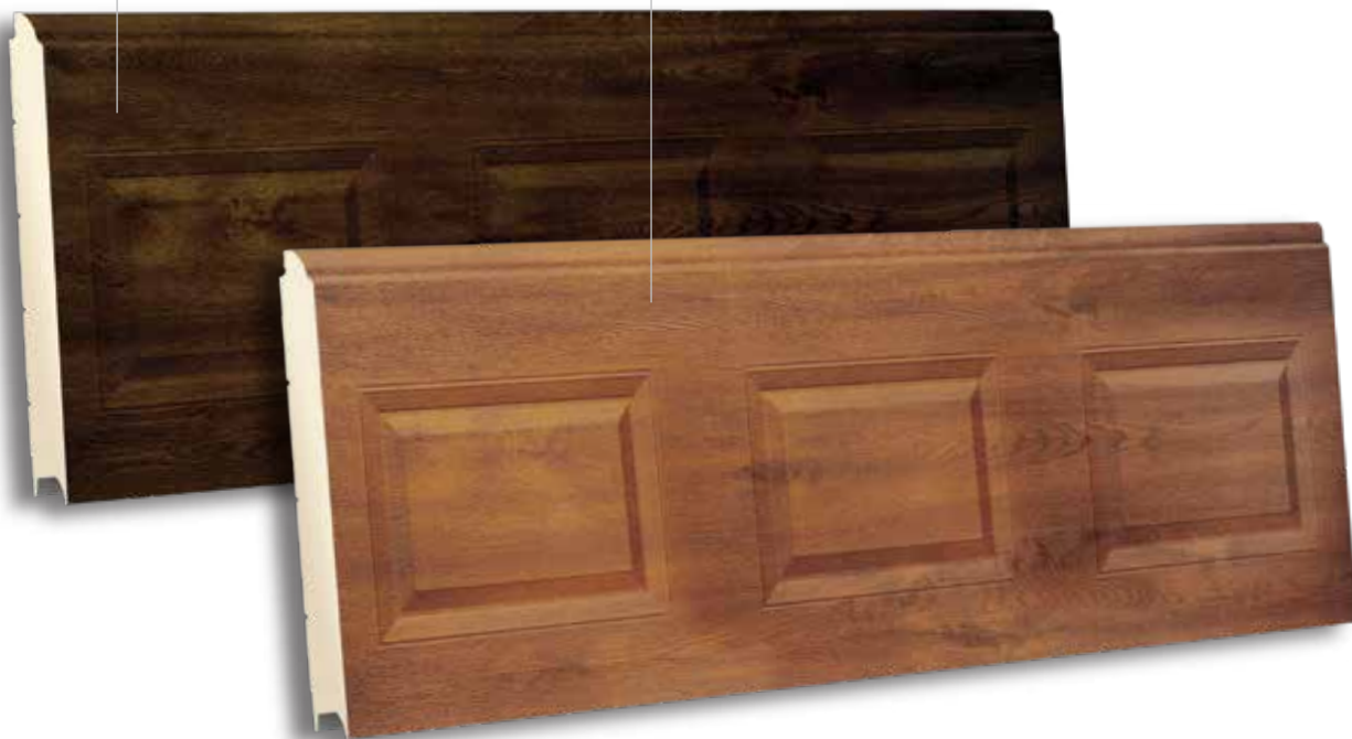
TSQ 500 V-GOLDEN - WOODGRAIN