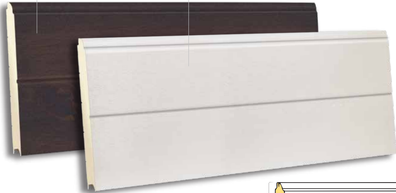
TSL 610 RAL 9010- WOODGRAIN