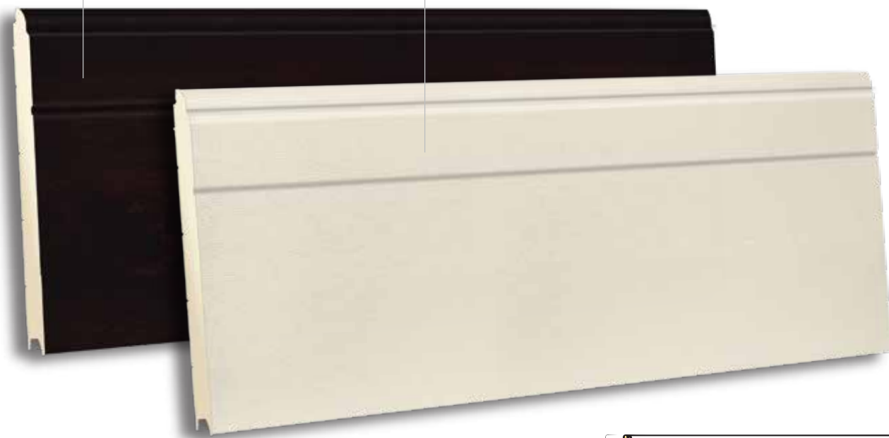
TSD 610 RAL 9002- WOODGRAIN