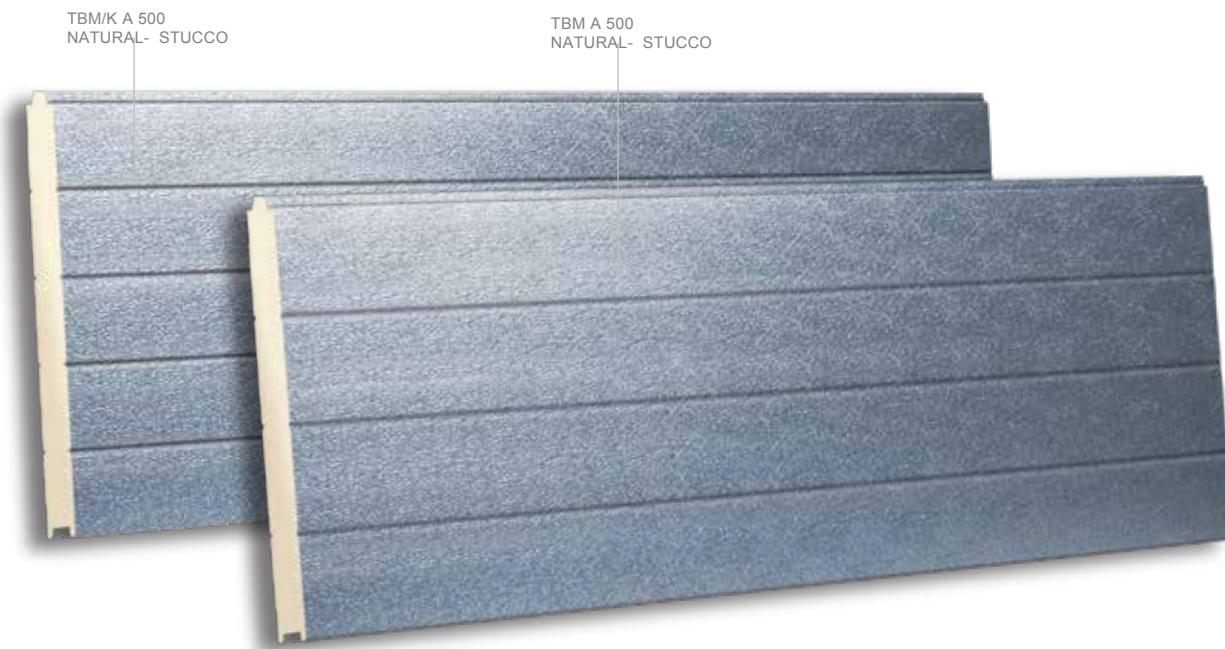
TBM/K A 500 NATURAL- STUCCO