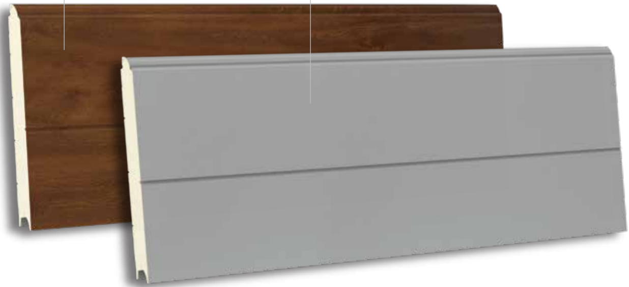
TSV 500 RAL 9006- WOODGRAIN