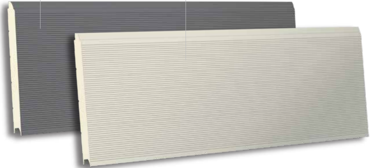
TSR V8 500 RAL 9002 - GLATT