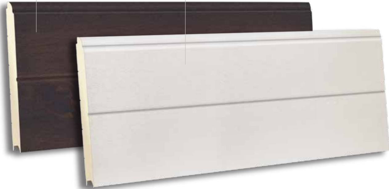
TSL 610 RAL 9010- WOODGRAIN